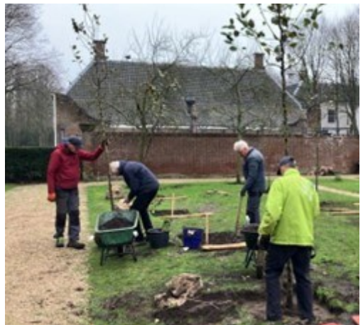
Vrijwilligers planten fruitbomen in de kruidentuin