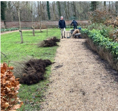
Herstel van de hagen in de Neobaroktuin

Speelhuisjes stonden dan ook op 'strategische' plaatsen in de parkaanleg, aan het einde van een zichtas, vaker nog aan de rand of op de hoek van het terrein, nabij de (water)weg. Op Beeckestijn boden de theehuisjes uitzicht op het toenmalige Wijkermeer.