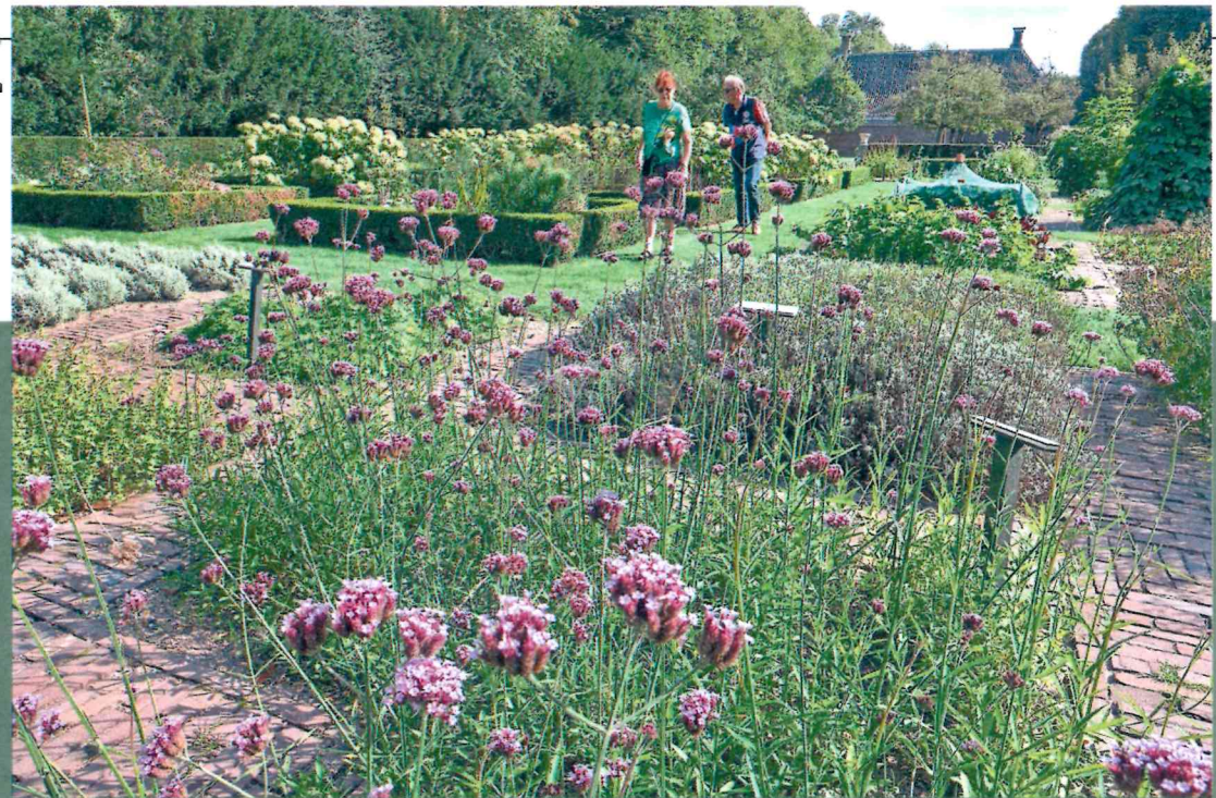
De paarse bloemen van de Verbena bonariensis zijn een blikvanger in de kruidentuin van Beeckestijn. Ook hier zijn de rechte paden en plantenvakken, zo typerend voor de Franse barok, terug te zien.

leeuwenbek, Zinnia met crème-fuchsialeurige bloemen en rood-bloeiende Canna met zijn op bananenplant lijkende bladeren. De Verbena bonariensis , de hoge ijzerhardsoort, steekt er met zijn paarse bloemen fier bovenuit. Achter het landhuis onthullen de lindebomen naast de belangrijkste zichtas hoe welvarend de bewoners vroeger waren. Althans hoe welvarend ze wilden overkomen. Maar liefst vier rijen dik staan de lindes links en rechts naast het pad dat vanuit het huis het zicht vrijhoudt op de bloemvormige vijver met fontein. Groepen hoge lindebomen staan ook links en rechts naast het hoofdhuis. In rechthoekige vakken staan dertig exemplaren