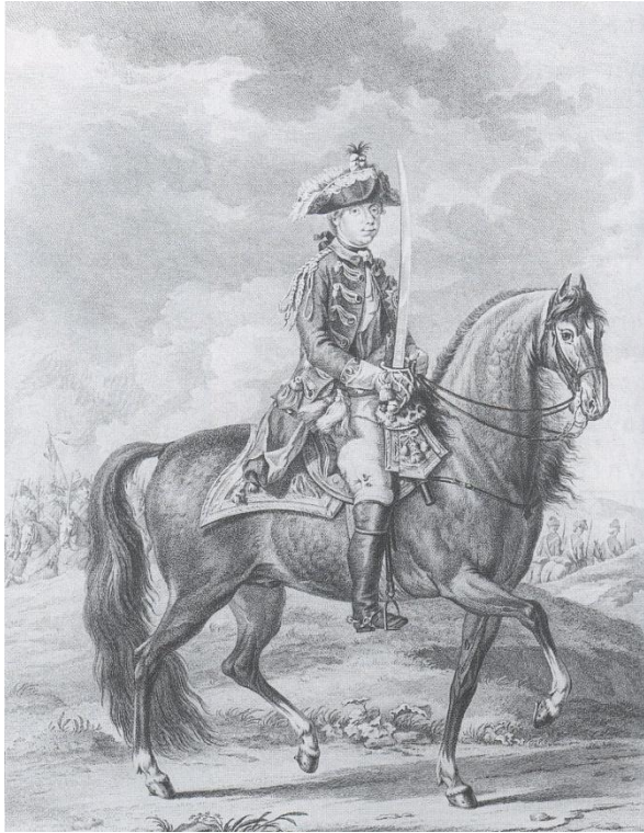
Prins Willem V van Oranje (1748-1806) R.Vinkeles naar T.P.C. Haag Kopergravure