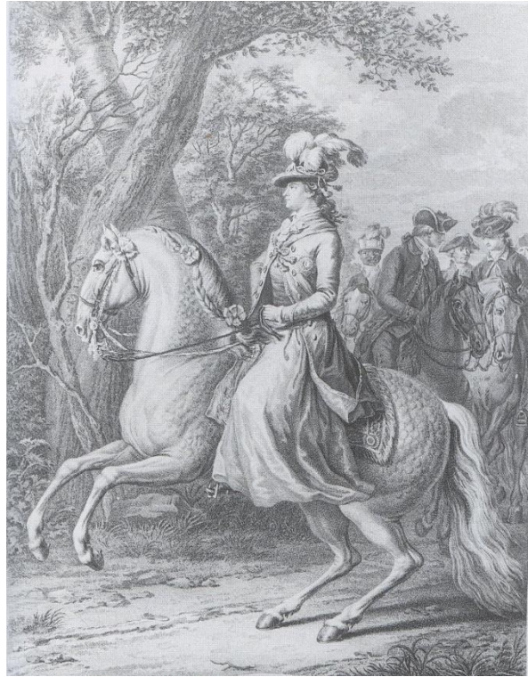
Wilhelmina van Pruisen (1751-1820) R.Vinkeles naar T.P.C. Haag Kopergravure

Net als Willem-Alexander en Maxima in 2002, maakten de jonge Willem V van Oranje en zijn echtgenote Wilhelmina na hun huwelijk in 1767 een kennismakingsreis door het land. Van 24 tot en met 29 mei 1768 logeerden zij daarbij op Beeckestijn. Dit is in mei precies 250 jaar geleden, in de gloriejaren van de buitenplaats.