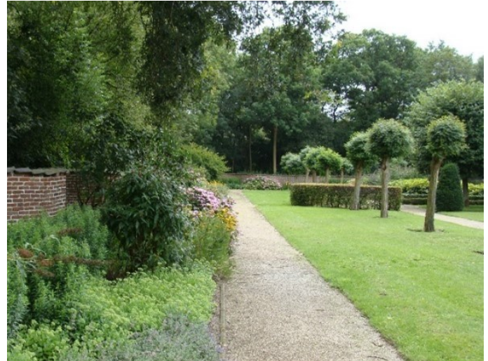
Op de foto de oude boompjes in betere tijden

Voor € 250 kunnen particulieren of bedrijven een bolacacia sponsoren en ons zo helpen om de neobaroktuin op Beekestijn nóg mooier te maken! Als dank organiseren we later dit jaar een exclusieve rondleiding voor alle sponsoren. De Vrienden van Beekestijn sponsoren ook een boom.